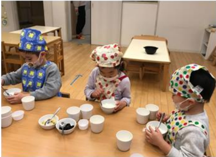
黒豆蒸しパンクッキング