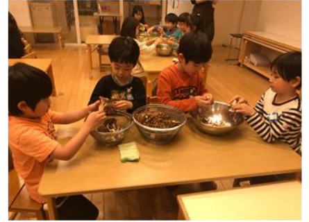
神田部屋ちゃんこ鍋 食材の準備