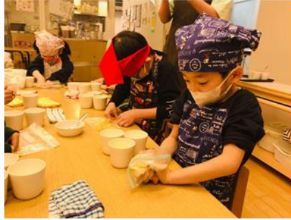
スイートポテトクッキング