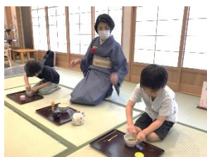
お茶会の様子 ~簡単な作法や礼儀を知り、お茶を点てています~