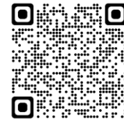
保育雑誌ハグシル

保育雑誌ハグシルにて6月のお誕生日会の様子が掲載されています。お誕生日会の献立や、シェフの保育園給食への想いがつづられています！是非読んでみてください！